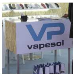
106 x 49 cm = 30€