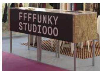
200 x 50 cm = 60€