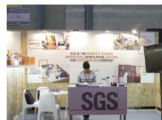
Otros tamaños = 45€/m 2

Estos vinilos no se reutilizarán una vez finalizada la feria. Aquellas empresas que lo deseen se los podrán llevar y volver a poner ellos directamente en la siguiente edición, pero ni AEC ni ESCATO nos hacemos responsables de su almacenaje.