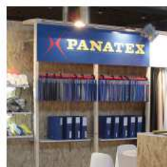
200 x 50 cm = 60€