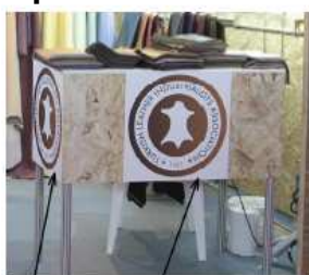
50 x 50 cm = 15€