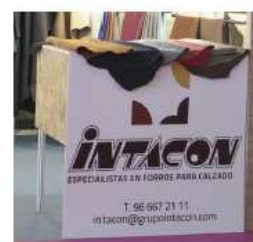
106 x 100 cm = 45€